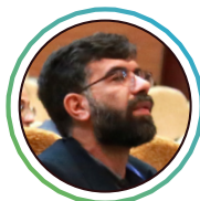
جناب آقای سعید زاهدی قائم‌مقام خانه خلاق و مرکز نوآوری قوه مقننه